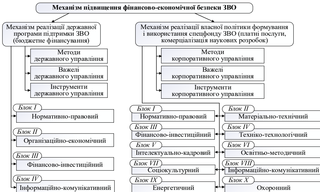
Рис. 2. Структура механізму підвищення фінансово-економічної безпеки ЗВО в системі забезпечення з боку держави та ЗВО

Для усунення негативних відхилень ЗВО розробляються заходи. Отже, найкращими методами для оцінювання рівня фінансово-економічної безпеки ЗВО є індикативний метод та метод оцінки за відхиленнями.