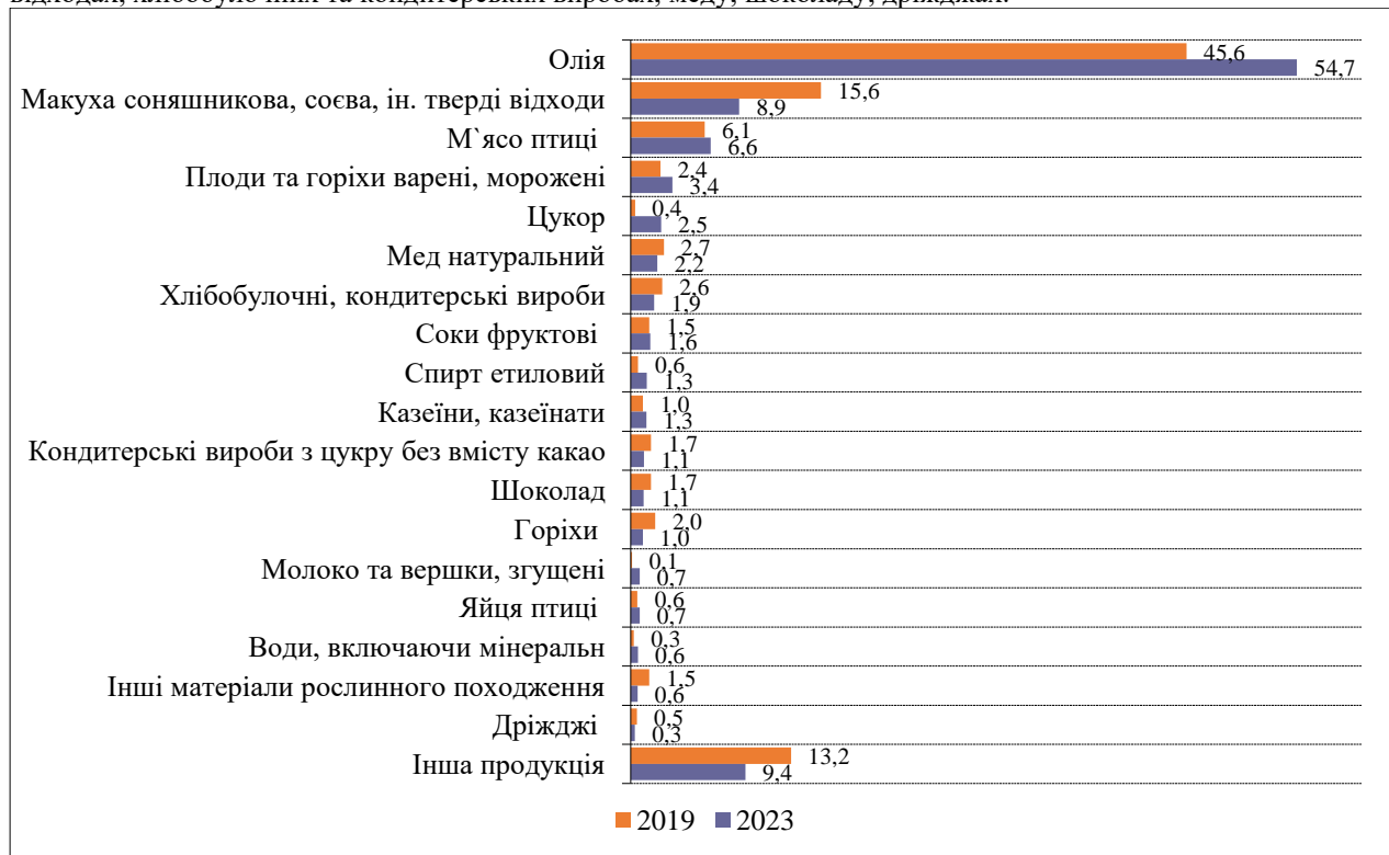
Рис. 3. Структура експорту основних не сировинних видів агропродовольчої продукції з України в Європейський Союз, 2023 р., %

Розглянемо товарну структуру у вартісному вимірі несировинного агроекспорту з України до ЄС у 2023 р. (рис. 2). Безумовним лідером продажу залишається олія (усі види), частка якої з 2021 р. перевищує 50% у структурі всього несировинного агроекспорту. Зі значним відривом, нижче розташувалися макуха, м'ясо птиці, плоди та горіхи варені та морожені, цукор, мед та інші види продукції. Відмітимо, що асортимент експортованої продукції в Європейський Союз за останні 5 років практично не змінився (див. рис. 3), хоча обсяги експорту зросли (див. рис. 1). В розрізі харчових продуктів за період 2019-2023 рр. зросла частка олії, м'яса птиці, плодів та горіхів варених, казеїну, цукру, спирту етилового, молока та вершків, соків фруктових. Зменшення частки зафіксовано по макусі соняшниковій, соєвій та інших твердих відходах, хлібобулочних та кондитерських виробках, меду, шоколаду, дріжджах.