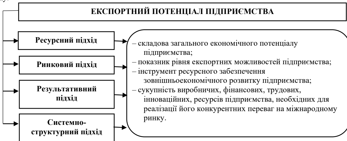
Рис. 2. Підходи до розуміння сутності поняття «експортний потенціал підприємства»

Беручи до уваги вище зазначені дефініції, ми вважаємо за доцільне консолідувати сутнісні характеристики понять «експортний потенціал» з точок зору різних підходів. Таким чином, ми вважаємо, що експортний потенціал – це складова загального економічного потенціалу підприємства, що забезпечує реалізацію його експортних можливостей використовуючи наявні виробничі, трудові, фінансові, інноваційні та інші види ресурсів, необхідних для формування конкурентних переваг підприємства на міжнародному ринку.