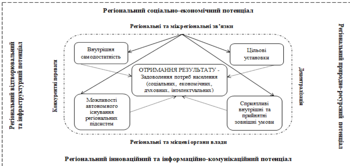
Рис. 1. Концептуальне бачення саморозвитку регіону на засадах формування ресурсного потенціалу (розробка автора)

Даний рисунок відображає бажану наявність у регіонів наступних складових ресурсного потенціалу: відтворювальний та інфраструктурний; соціально-економічний; природно-ресурсний; інноваційний та інформаційно-комунікаційний. Крім того, на регіональному рівні формуються такі складові економічної системи, як: конкурентні переваги, регіональні та міжрегіональні зв'язки, децентралізація, регіональні та місцеві органи влади. У процесі визначення складових системи, стає можливим головне завдання регіональної політики - отримання результату (задоволенні потреб населення), яка може бути досягнута завдяки внутрішній самодостатності, цільовим установкам, сприятливі внутрішні та прийнятні зовнішні умови, можливості автономного існування регіональних підсистем.