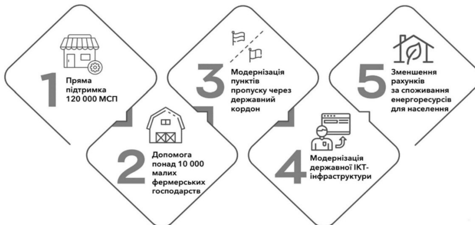
Рис. 3. Рекомендації щодо допомоги ЄС Україні під час COVID-19 [8]

Щоб прискорити довгострокове відновлення після пандемії COVID-19, Економічний та інвестиційний план ЄС у рамках Східного партнерства залучить до 6,5 мільярдів євро державних та приватних інвестицій в Україну у співпраці з міжнародними фінансовими організаціями. План передбачає реалізацію п'яти флагманських ініціатив в Україні для стимулювання розвитку інноваційної та конкурентоспроможної економіки, економічного благополуччя в сільській місцевості, покращення зв'язку, цифрової трансформації та підвищення енергоефективності [5] (рис. 3).