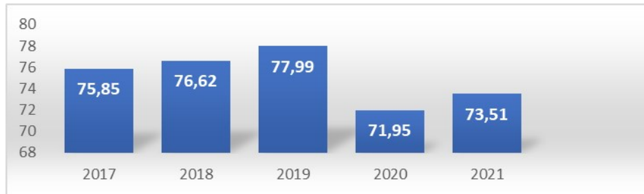
Рис. 2. Динаміка частки прямих іноземних інвестицій з України до країн ЄС у 2017–2021 роках, % Примітка. Побудовано автором за даними [3].

42,279 млрд дол. США. У 2020 році прямі інвестиції зменшилися до рівня 37,479 млрд дол. США, або на 11,35%. В 2021 році ПІІ з країн ЄС становили 45,671 млрд дол. США і зросли на 21,86%. У 2017–2021 роках динаміка частки прямих іноземних інвестицій з України в країни ЄС мала тенденцію до зниження з 75,85% до 73,51% у 2021 році [3] (рис. 2).