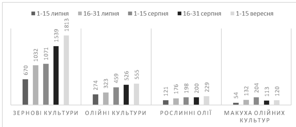
Рис. 3. Динаміка експорту основних продуктів АПК, тис. тонн

Завдяки функціонуванню «зернової угоди» Україні вдалось експортувати 2,9 мільйона тон продукції АПК за 15 днів вересня. Найбільші темпи приросту демонструють зернові культури, експорт яких зріс на 69%. Динаміка експорту основних продуктів АПК протягом липня-вересня поточного року зображена на рис. 3. При збереженні існуючих темпів за результатами вересня можна очікувати вивезення продукції АПК на рівні 6 млн. тон, що відповідає середньому значенню аналогічного показника за минулий рік.