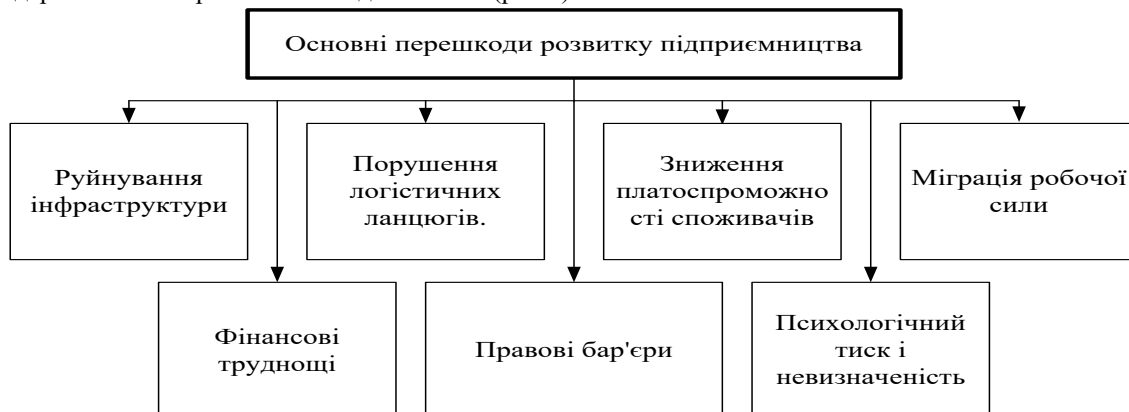
Рис.2. Основні перешкоди розвитку підприємництва в Україні в умовах воєнного стану

Основними перешкодами для розвитку підприємництва сьогодні є: зниження попиту на певні товари та послуги; руйнування необхідних ланцюгів постачання; значне зростання вартості товарів і послуг, що змушує виробників підвищувати ціни, що в свою чергу негативно впливає на попит; зростання цін на обладнання; втрата клієнтів і звуження ринків постачання; вичерпання оборотних коштів і обмеження фінансових ресурсів. До ключових перешкод для розвитку підприємництва в сучасних умовах господарювання в Україні можна віднести такі (рис.2).