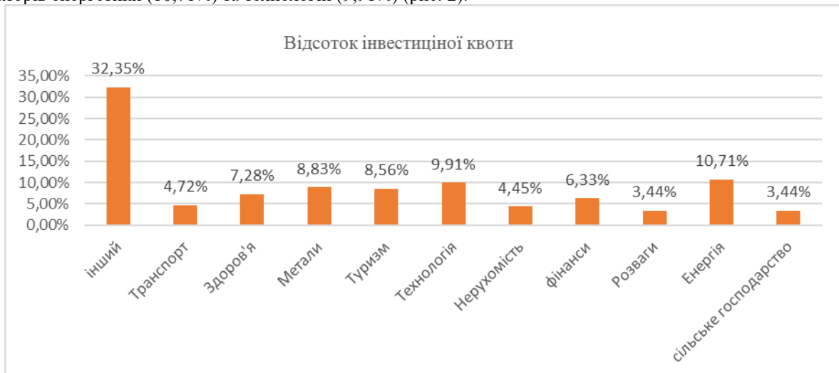
Рис. 2. Галузева структура китайських ПІІ до Індії у 2012-2020* році

Галузева структура китайських ПІІ до Індії є досить диверсифікованою з вагомою часткою до секторів енергетики (10,71%) та технологій (9,91%) (рис. 2).