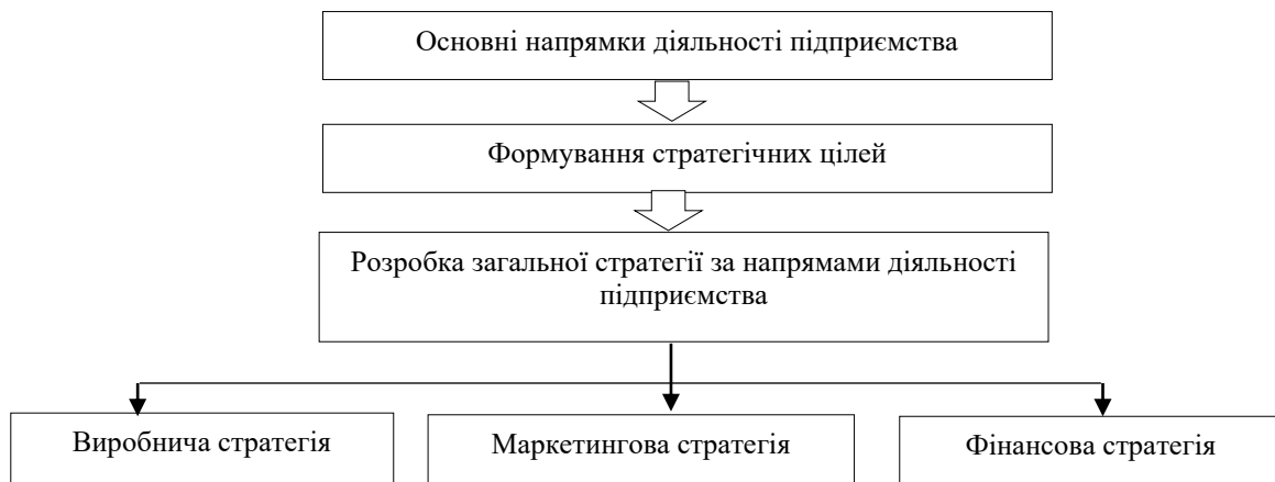
Рис. 1. Місце фінансової стратегії у загальній стратегії розвитку підприємства [5]

Вважається, що першочерговим завданням підприємства є розвиток здорової конкуренції, яка визначається в процесі розроблення виробничої та маркетингової стратегій.