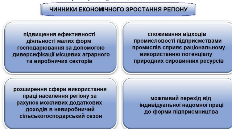
Рис. 3. Чинники економічного зростання регіону виробництва НХП

Важливим є те, що розвиток галузі НХП може бути одним із факторів економічного зростання та покращення якості життя на сільських територіях (рис. 3).