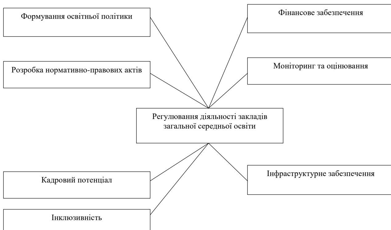
Рис. 1. Регулювання діяльності закладів загальної середньої освіти

Основні аспекти процесу регулювання діяльності закладів загальної середньої освіти включають декілька обов'язкових складових, що представлено на рис. 1.