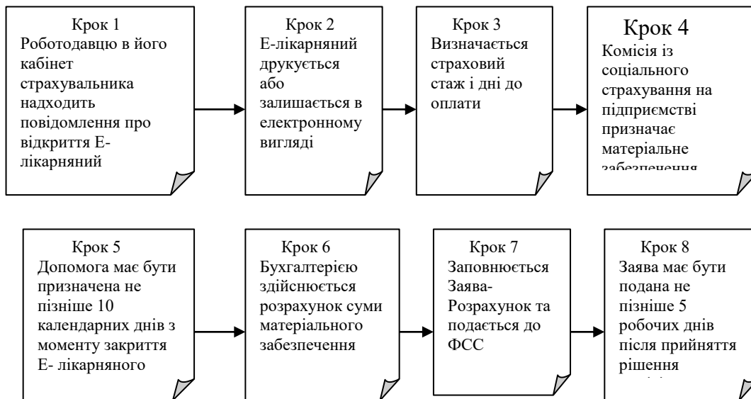
Рис. 1. Порядок проходження Е-лікарняного на підприємстві

групи не оплачується, згідно п.4.3 Інструкції № 455; відсутній запис стосовно направлення працівника на МСЕК (це стосується обмеження 120 або 156 календарних днів у разі безперервної непрацездатності, а у разі захворювання на туберкульоз не більше 10 місяців, згідно Наказу МОЗ № 189 від 09.04.2008 р.). Перші п'ять днів Е-лікарняний оплачуються за рахунок заводу. Починаючи з шостого дня за рахунок Фонд Соціального Страхування. Як відбувається проходження Е-лікарняного на підприємстві зображено на рис. 1.