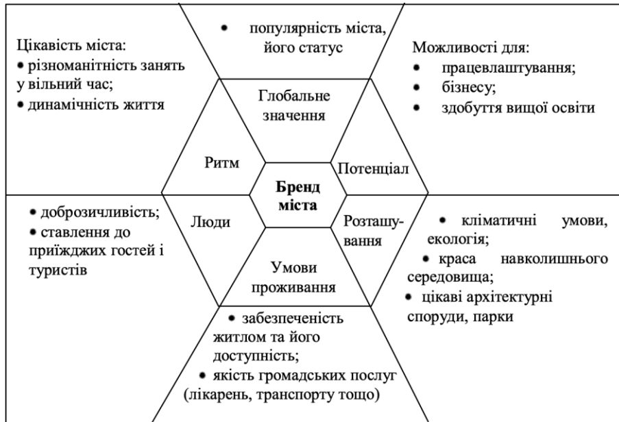
Рис. 1. Критерії оцінки бренду міста Олени Біловодської та Наталії Гайдабрус [4]

Саймон Анхольт вважає, що швидкий розвиток глобалізації має означати те, що кожна країна, кожне місто і кожен регіон повинні конкурувати між собою за свою частку споживачів, туристів, інвесторів, студентів, підприємців, міжнародних спортивних і культурних заходів, а також за увагу і повагу на міжнародних платформах, серед інших урядів і населення іноземних країн.