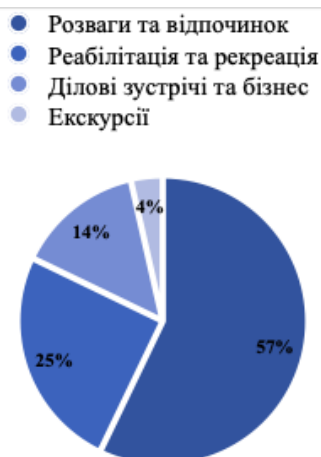
Рис. 3. Статистика відвідувань респондентів курорту Східниця за метою подорожі (за даними кількісного опитування)

Звичайно, що інфраструктура та якість сервісу мають вирішальне значення для створення загального враження туриста про відпочинок на тій чи іншій території. Тому, ми запитали у респондентів як вони оцінюють рівень сервісу та розвитку інфраструктури на курорті Східниця і відповіді насправду були дуже неоднозначні, тому і середнє значення оцінки за шкалою від 1 до 5 склало всього три бали. Це можна пояснити тим, що: по-перше, туристи мали різний досвід подорожі до Східниці, по-друге, обрали для себе заклади розміщення та відпочинку різних категорій. Крім того, можливо, інфраструктура та сервіс на курорті не відповідали очікуванням деяких туристів, що також повпливало на їхні оцінки. А для того, аби картина оцінки якості змінилась на більш позитивну, необхідно вжити заходів щодо поліпшення якості сервісу, розвитку інфраструктури та відповідного просування курорту серед туристів з різними очікуваннями та можливостями.