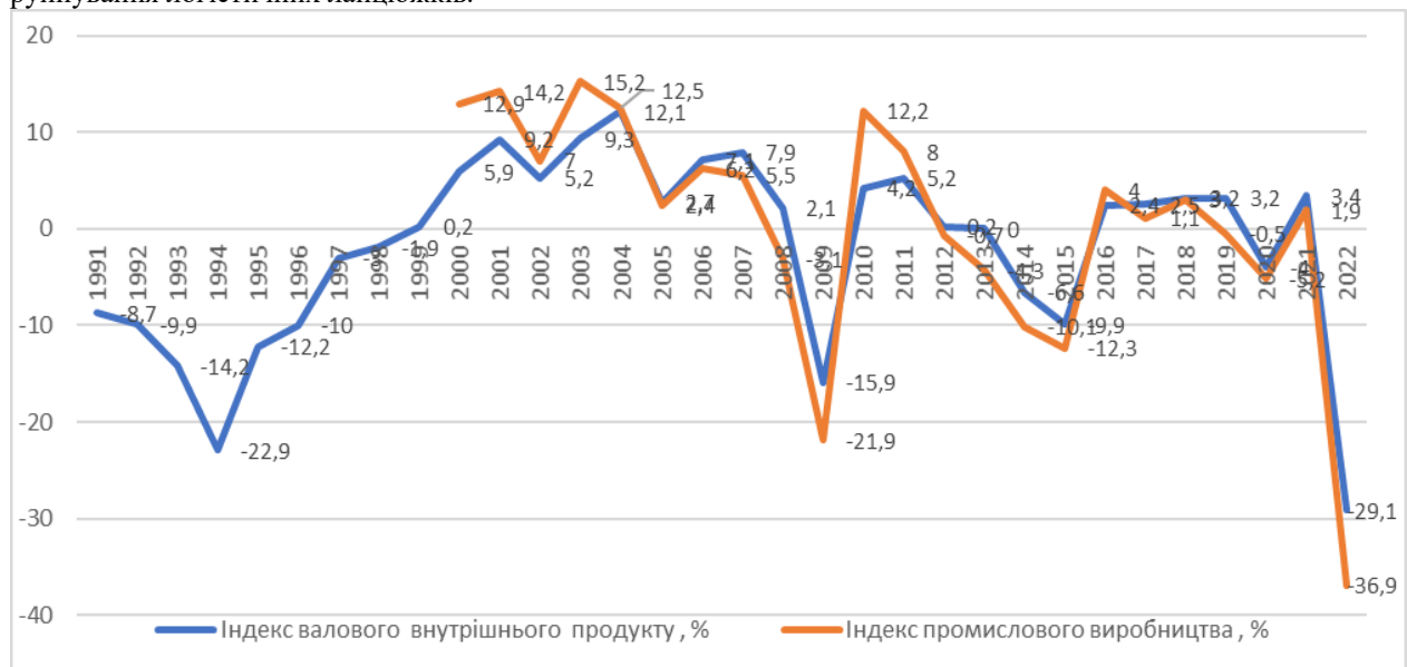
Рис. 1. Динаміка індексів валового внутрішнього продукту та промислового виробництва, %

Оцінку трендів розпочнемо з дослідження основних макроекономічних показників: індексів валового внутрішнього продукту та промислового виробництва (рис. 1); динаміки експорту, імпорту та сальдо зовнішньої торгівлі України (рис. 2). Наведені дані свідчать про те, що увесь час розвитку економіки України можна розглядати як постійну «гойдалку» спад-відновлення. Адже на рисунку 1 явно помітні чотири масштабні кризи. Така динаміка з одного боку свідчить про надзвичайно складні умови розвитку й функціонування бізнесу, з іншого – швидку адаптацію та гнучкість вітчизняних бізнес-структур. Завдяки вмінню пристосовуватись до нових умов функціонування українська економіка і в умовах війни починає поживавлюватись, не зважаючи на пошкодження критичної інфраструктури, виробничих потужностей та руйнування логістичних ланцюжків.