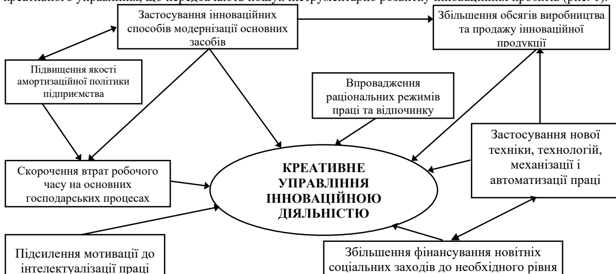
Рис. 1. Вектори креативного менеджменту в контексті розвитку інноваційних проєктів

Правильність теоретичних положень, адекватність розроблених вченими-економістами моделей реальним економічним і соціальним процесам, практичну їхню прийнятність виявляють необхідність визначення причин зниження креативності та інноваційності праці в умовах конкретного підприємства. На підставі економічних та соціальних викликів, доречно підприємствам орієнтуватися на низку векторів креативного управління, що передбачають пошук інструментарію розвитку інноваційних проєктів (рис. 1).