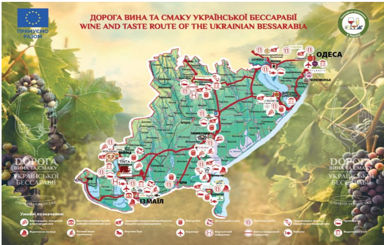
Рис. 2. Еногастрономічний маршрут «Дороги вина та смаку Української Бессарабії»

проживають, – передусім, українського, болгарського, молдавського, гагаузького та липованського. Загальна протяжність маршруту становить близько 900 кілометрів (рис. 2).