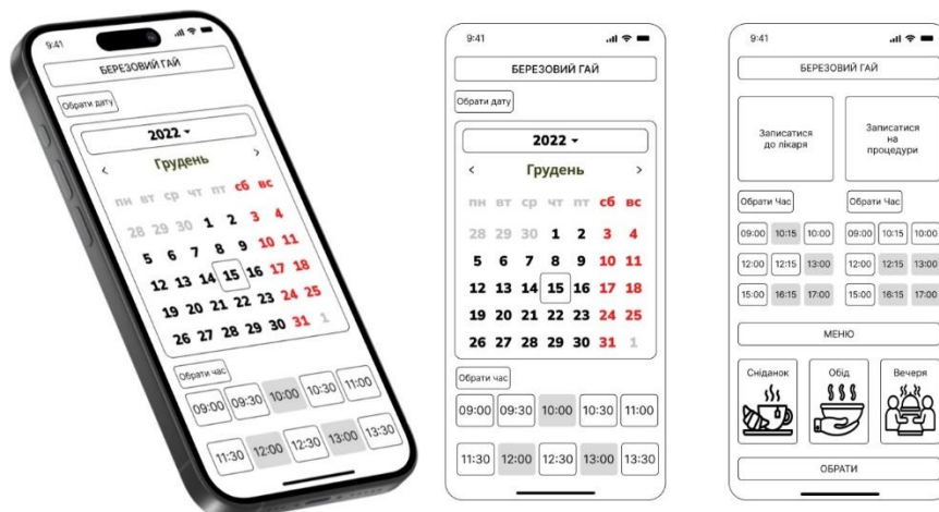
Рис. 2. Мобільний застосунок «WellnessNavigator» для запису до лікаря, на проходження лікувальних процедур та для вибору меню

Для ефективної організації лікувальних послуг можна використати застосунок «WellnessNavigator» (рис. 2).