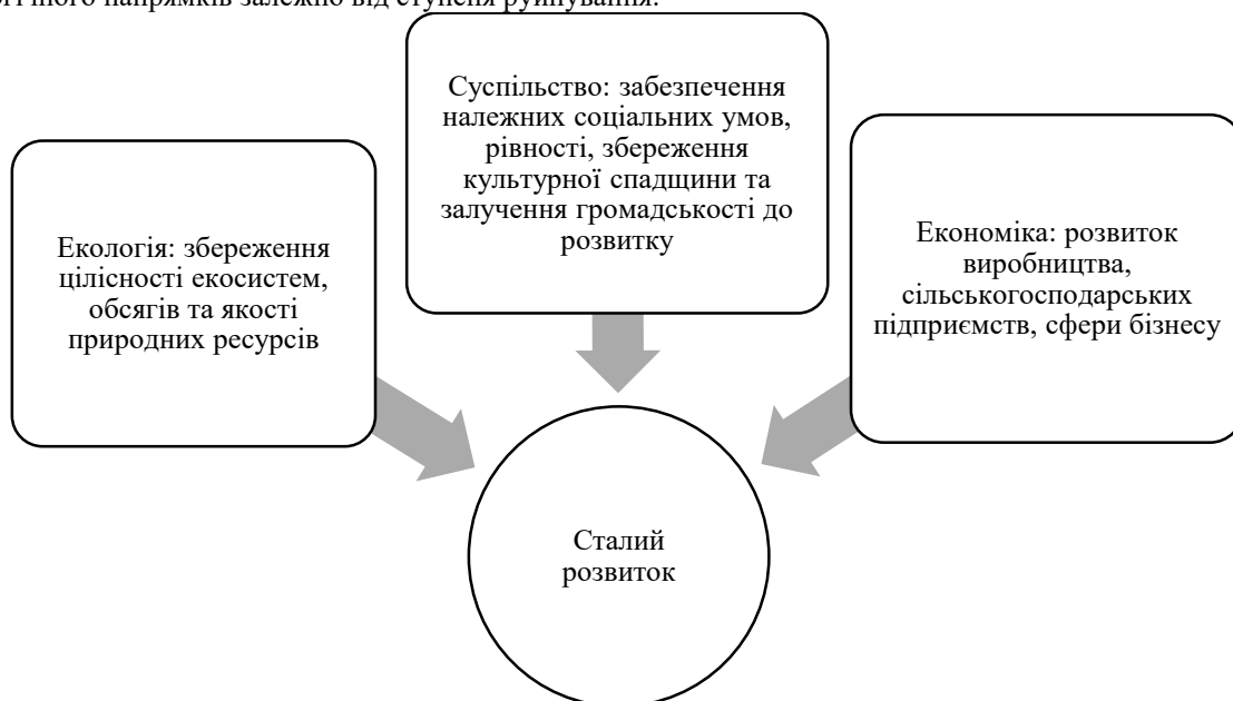
Рис. 3. Складові трьохчинникової моделі сталого розвитку

Особливості сталого розвитку регіонів України у повоєнний період витікають з необхідності врахування складових трьохчинникової моделі для розробки необхідних заходів щодо його забезпечення (рис. 3). Сутність цих особливостей полягає в різній актуальності проблем економічного, соціального та екологічного напрямків залежно від ступеня руйнування.