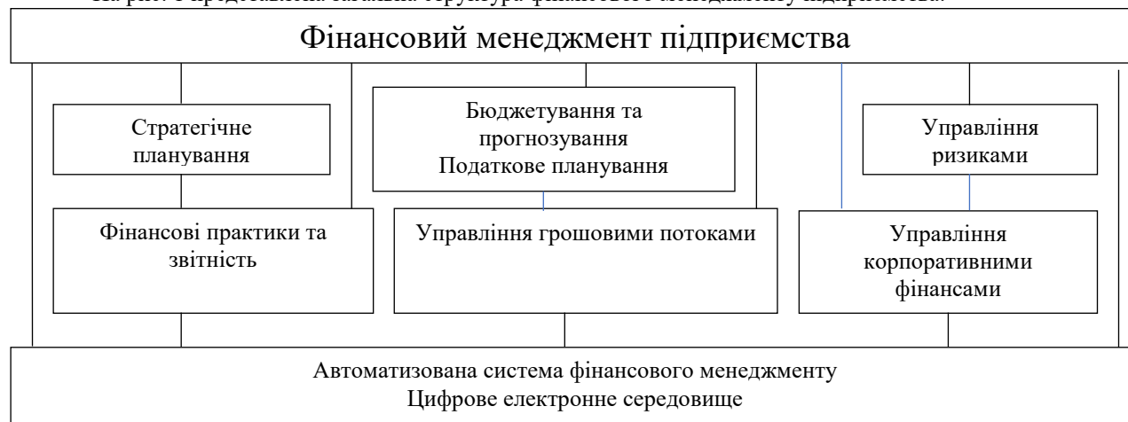
Рис. 1. Загальна структура фінансового менеджменту

На рис. 1 представлена загальна структура фінансового менеджменту підприємства.