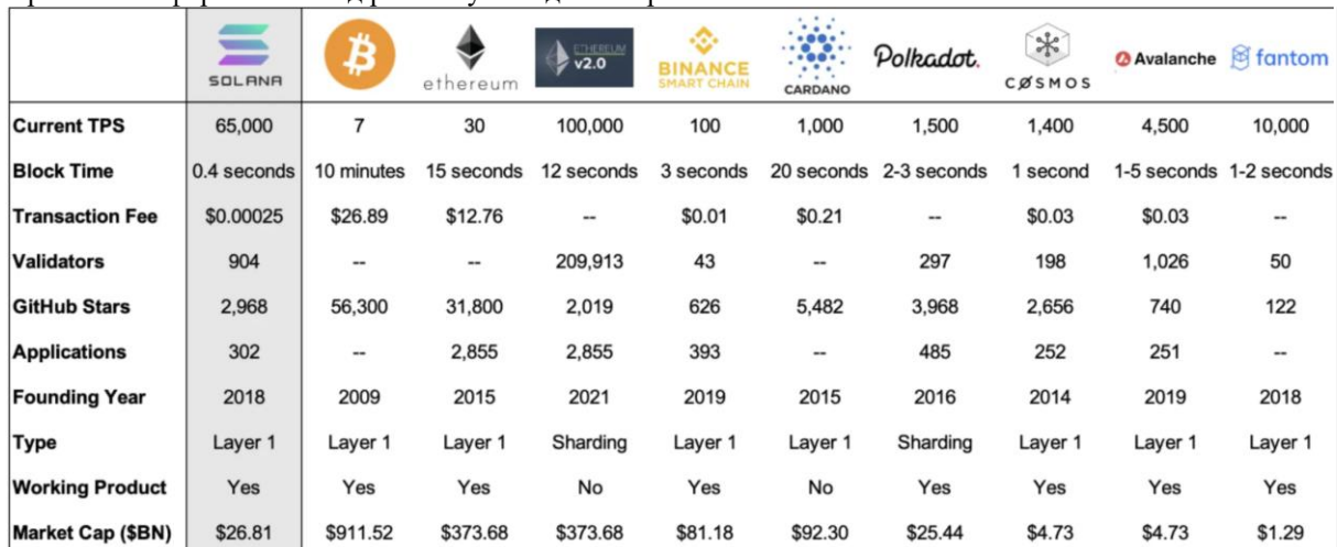
Рис. 2. Огляд блокчейн-проєктів та параметрів розвитку їх продуктів [10]

Зокрема це такі проєкти, як Solana, Near, Haken, які мають суттєві переваги в порівнянні з іншими проєктами по багатьох параметрах, зокрема таких як швидкість і дешевизна операцій, масштабування, капіталізація та партнерство. Перелік криптовалютних проєктів у яких є розгорнуті екосистеми, та які обирають платформний метод розвитку наведено на рис. 2.