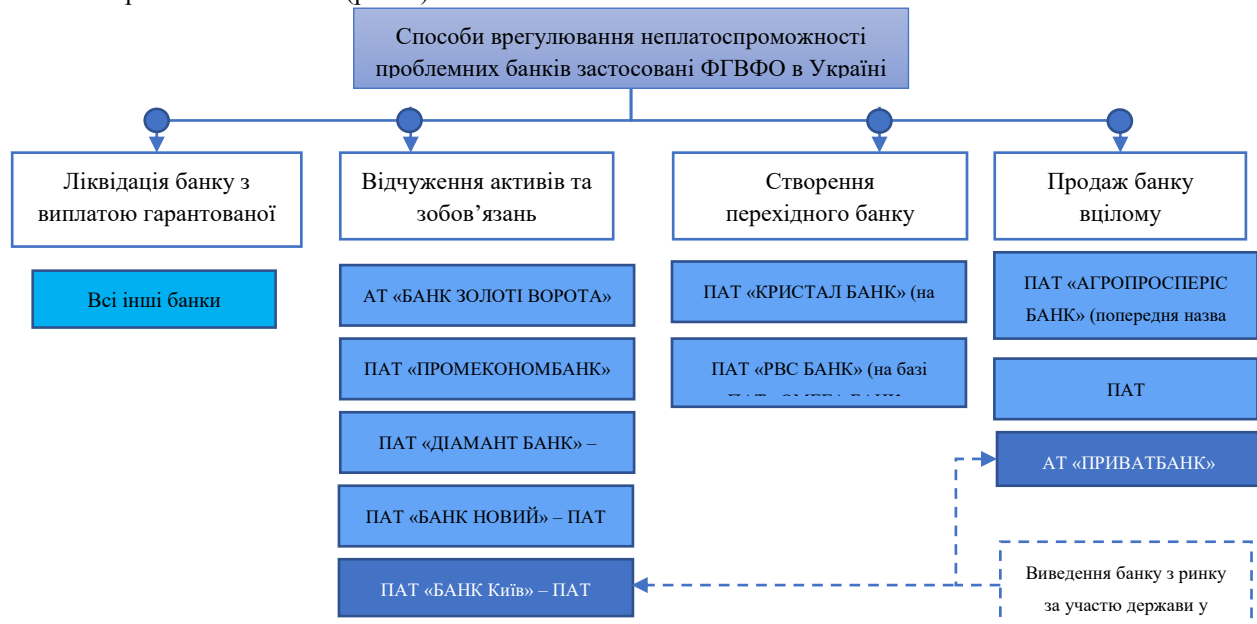
Рис.1. Способи, реалізовані ФГВФО для виведення з ринку проблемних банків

Фондом гарантування вкладів в Україні, з моменту передачі йому реформою 2012 року повноважень, щодо виведення банків з ринку, були застосовані різні способи врегулювання неплатоспроможності банків (рис. 1).