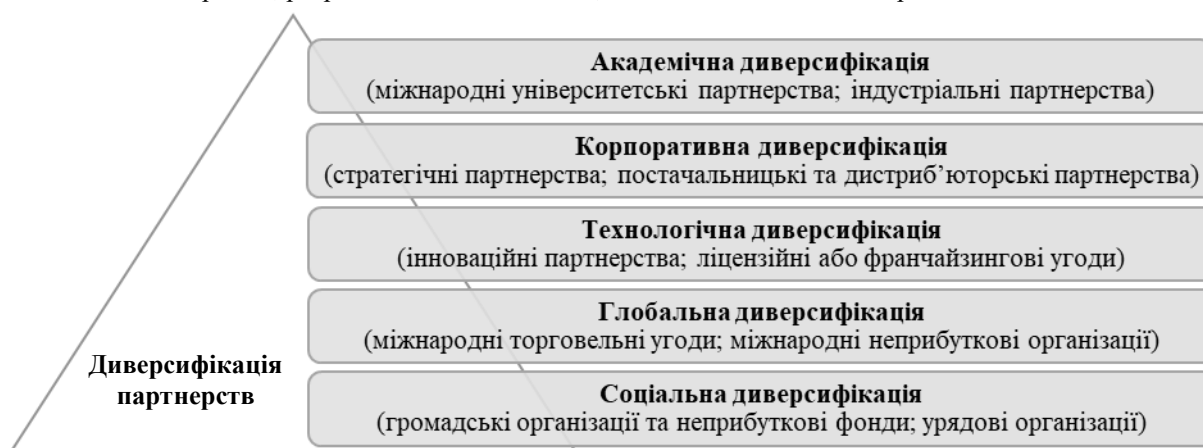
Рис. 2. Типи диверсифікації партнерств (сформовано автором на основі [1; 3; 4; 5; 6; 7; 10; 14])

Академічна диверсифікація передбачає вибудову зв'язків бізнес-структур із університетами різних країн для академічного обміну, імплементації практичного досвіду в освітній процес, можливостей працевлаштування випускників ЗВО тощо. Корпоративна диверсифікація ґрунтується на укладанні угод між ключовими гравцями в індустрії для спільного розвитку продуктів/послуг, розширення мережі постачальників та дистриб'юторів для забезпечення більшого охоплення ринку. Технологічна диверсифікація передбачає співпрацю на рівні партнерств інноваційних організацій, зокрема реалізації технологічних стартапів, розробки нових технологій, надання дозволів на використання технологій тощо.