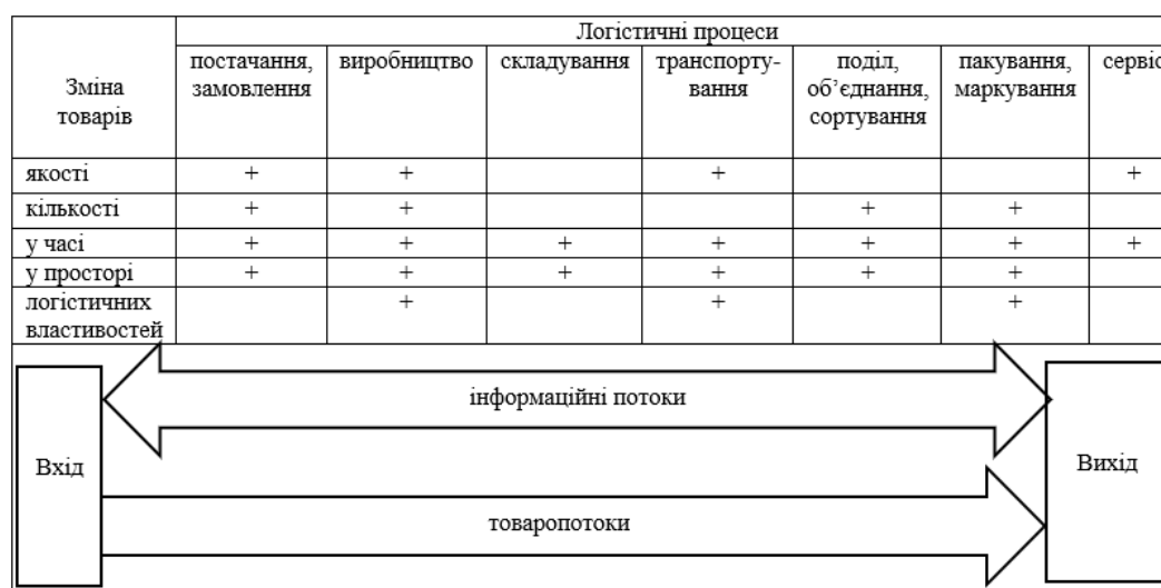
Рис. 1. Логістична система трансформації товарів з урахуванням логістичних процесів організації

Під час функціонування вантажопотоків операції інформаційної і матеріальної підсистем циркулюють паралельно та взаємодіють одна з одною. Адже, завжди матеріальні процеси супроводжуються переробкою інформації, а саме: транспортування, складування і перевантаження вантажів (оформлення транспортних документів і облік руху вантажів тощо). Логістична система трансформації товарів з урахуванням логістичних процесів організації представлена на рис. 1.