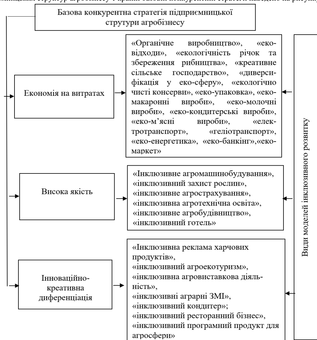
Рис. 1. Залежність виду інклюзивної моделі розвитку підприємницьких структур агробізнесу України від базової конкурентної стратегії

Під банком способів і прийомів визначається їх сукупність, яка охоплює усі функціональні види діяльності підприємства (формування продукту, ціноутворення, рекламування, збут, виробництво, управління персоналом, бюджетування, інвестування прибутку, фінансування). Його використання у галузях агробізнесу, які випускають економний, якісний, креативно диференційований продукт, має суттєві відмінності, оскільки їх підприємства використовують різні базові конкурентні стратегії (економія на витратах, висока якість, інноваційно-креативна диференціація) і, завдяки цьому, розвиваються за відмінними одна від одної інклюзивними моделями. Відповідність виду інклюзивної моделі розвитку підприємницьких структур агробізнесу України базовій конкурентній стратегії наведено на рисунку 1.