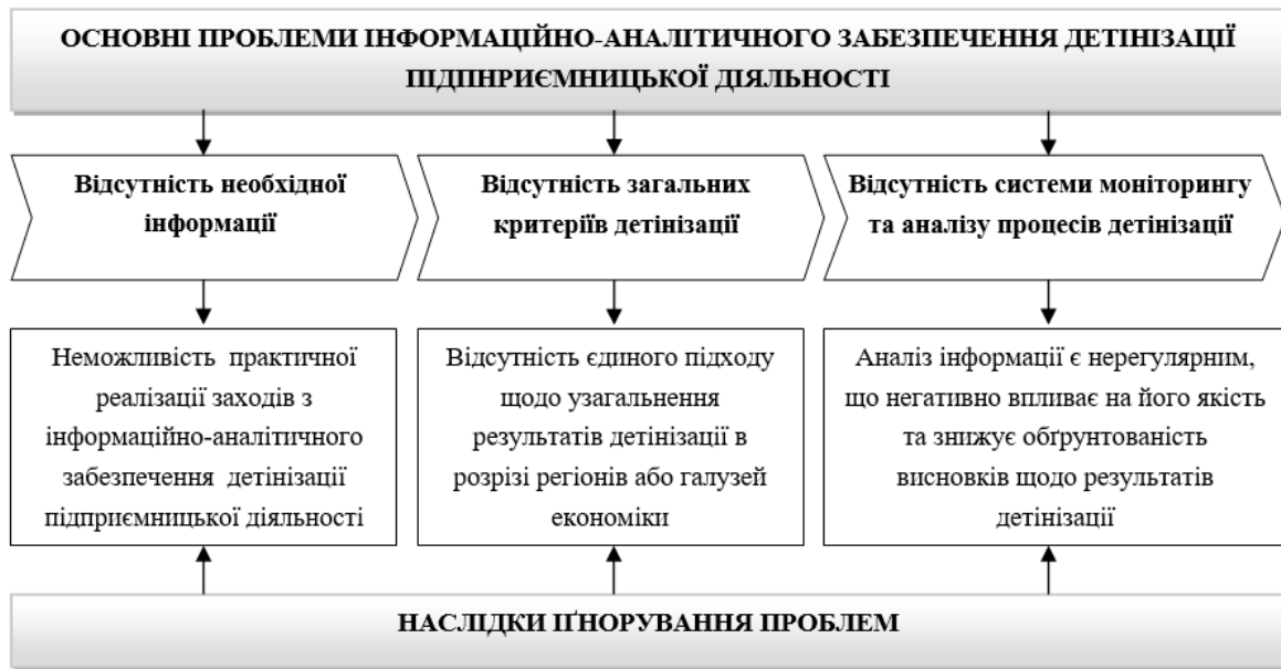
Рис. 1. Основні проблеми інформаційно-аналітичного забезпечення детінізації підприємницької діяльності

Далі доцільно детально розглянути як виділені проблеми інформаційно-аналітичного забезпечення детінізації підприємницької діяльності, так і способи їх вирішення. (оскільки сформульовані вище проблеми пов'язані між собою, способи їх вирішення також буде послідовним).