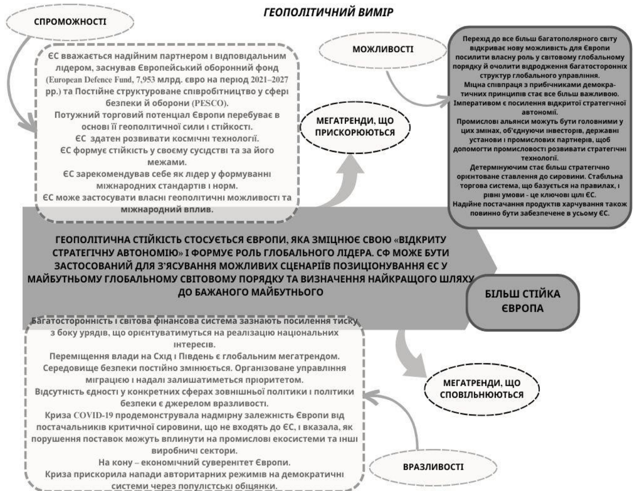
Рис. 2. Геополітичний вимір економічної безпеки ЄС

ризиками покликані сприяти фінансовій та економічній безпеці. Запропонований ЄС Закон про цифрову операційну стійкість (DORA) має значно підвищити стійкість фінансових установ і забезпечити кращий обмін інформацією між наглядовими органами [17].