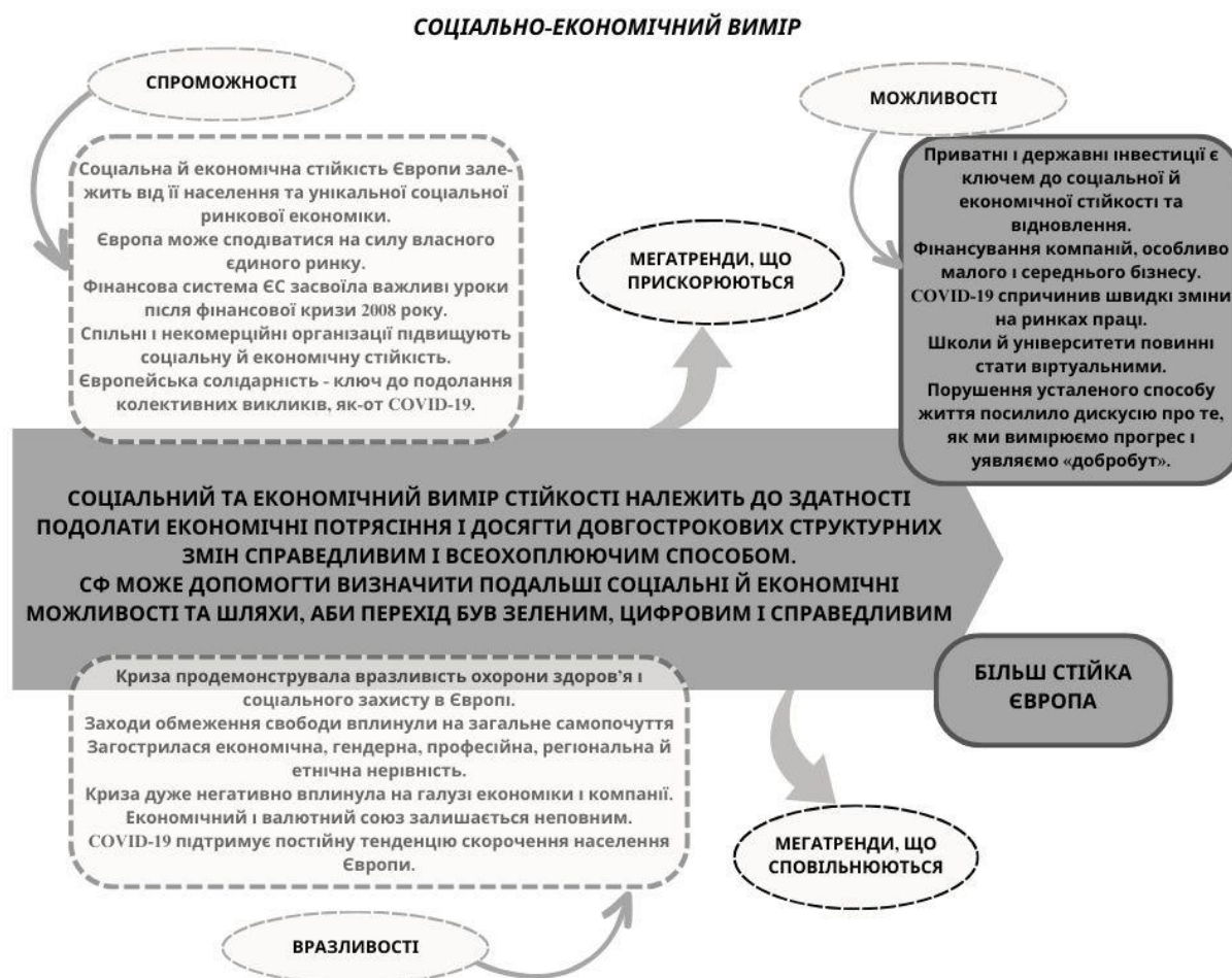
Рис. 1. Соціально-економічний вимір економічної безпеки ЄС

підтримку демократичних інститутів та інституцій, а відтак призводить до зростання запиту на політику популізму