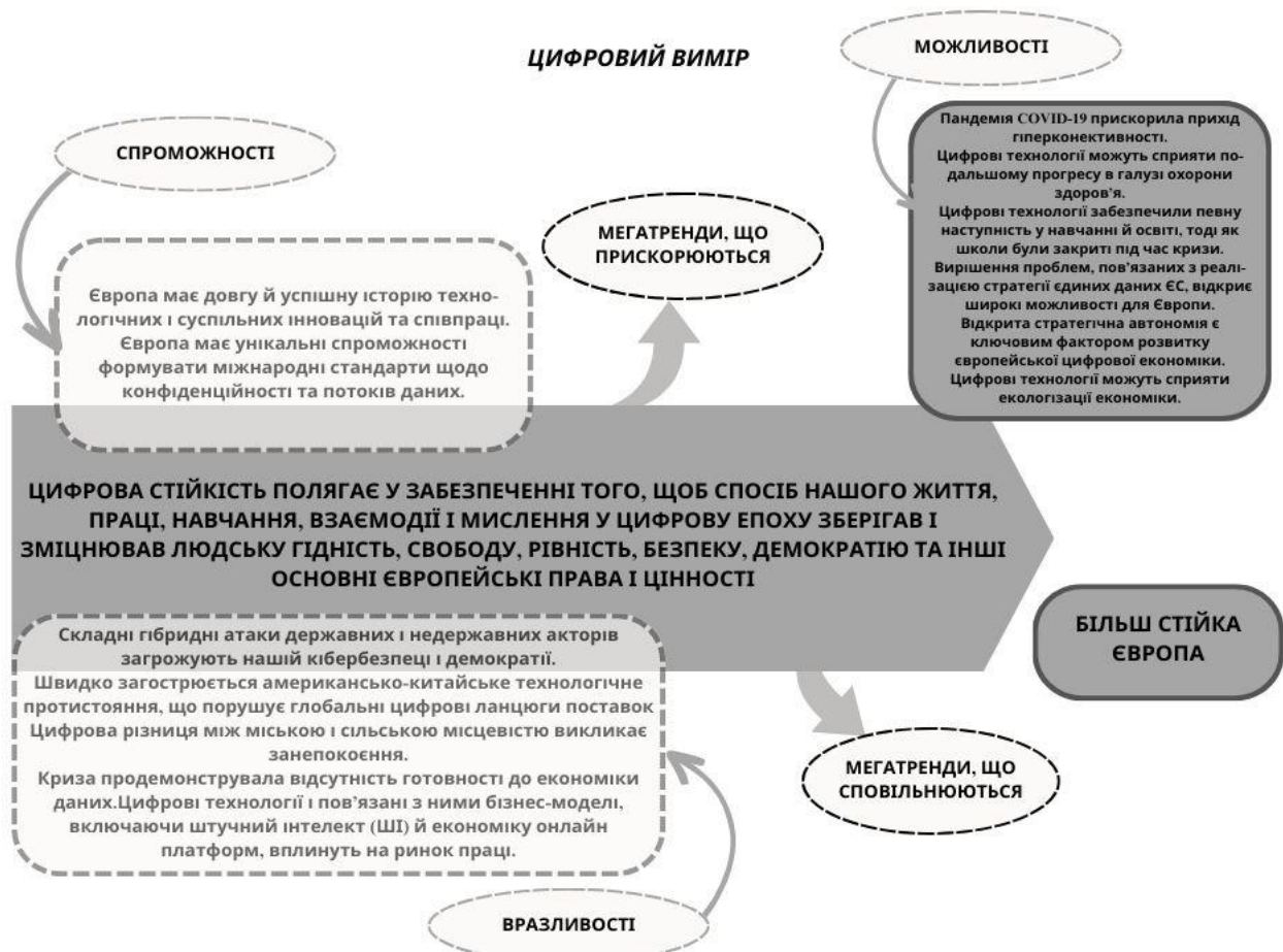
Рис. 4. Цифровий вимір економічної безпеки ЄС

справедливість; (5) розвиток нових компетенцій у працівників; (6) управління розвитком технологій; (7) зростання нерівності як у суспільстві, так і між країнами.