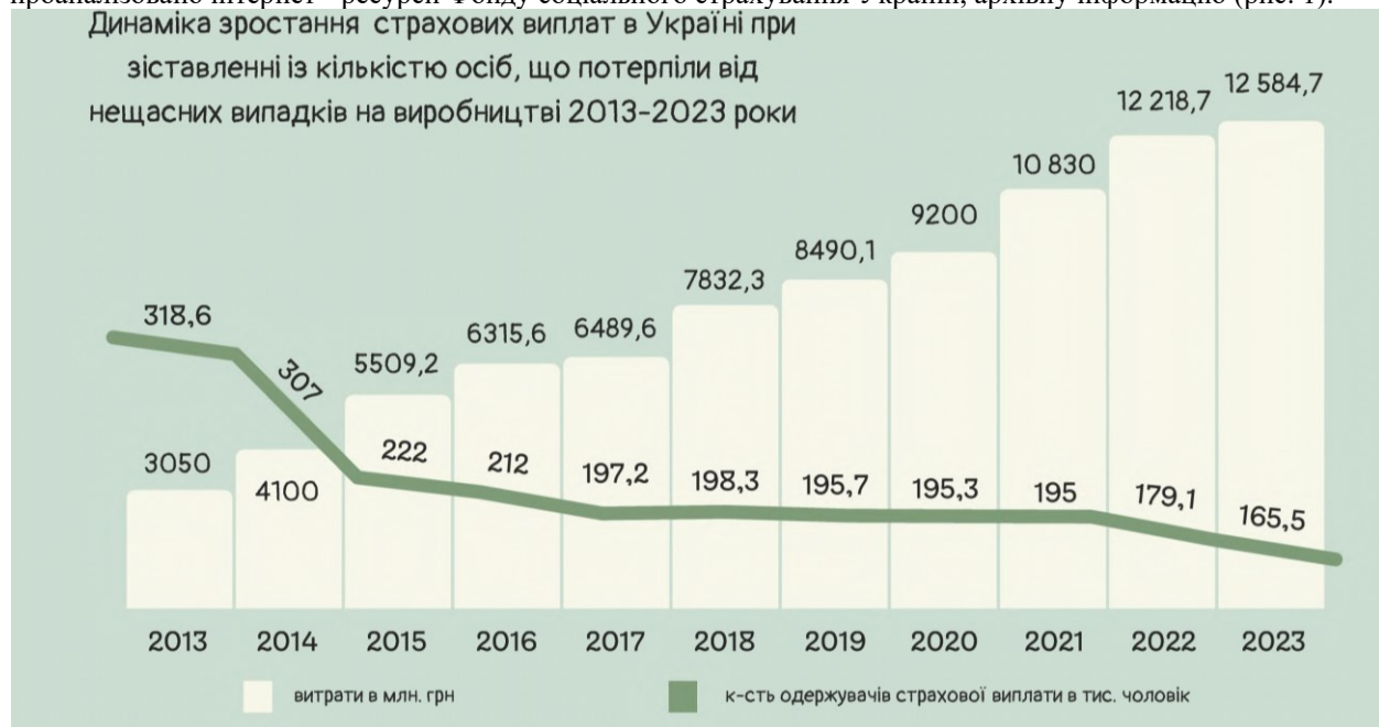
Рис. 1 Динаміка збільшення сум страхових виплат та зменшення кількості потерпілих за 2013-2023 роки

Вихідним аспектом проведення дослідження факторів детермінації витрат у системі від страхування НВ нами обрано аналіз динаміки страхових виплат за НВ на виробництві за 2013-2023 роки. З цією метою проаналізовано інтернет - ресурси Фонду соціального страхування України, архівну інформацію (рис. 1).