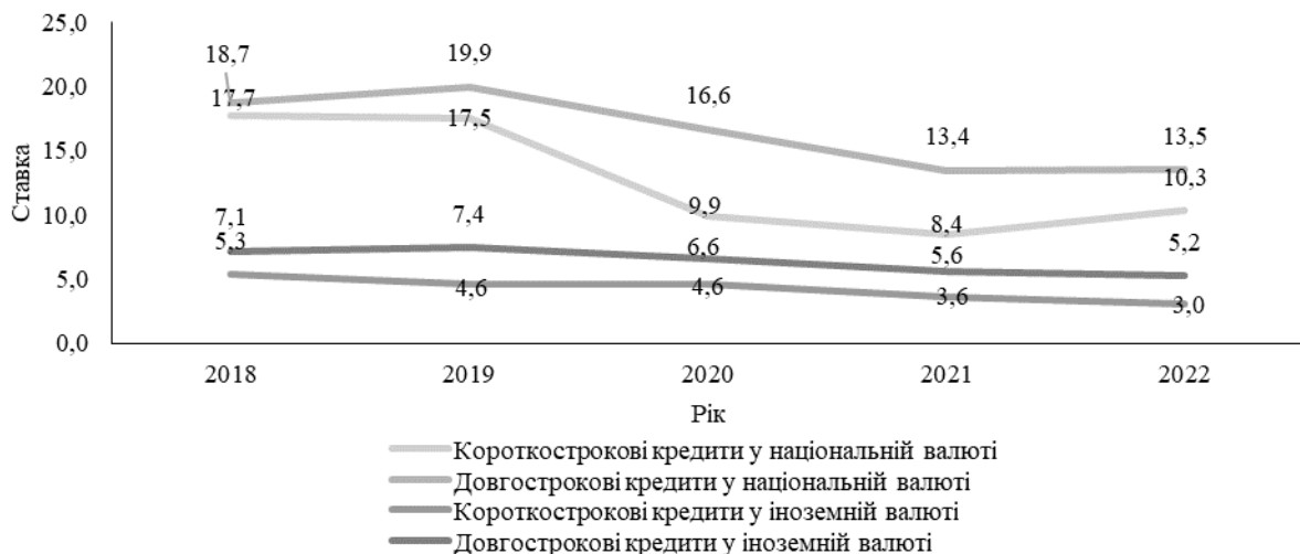
Рис. 3. Значення відсоткових ставок за кредитами у національній та іноземній валюті, наданих суб'єктам господарювання у 2018-2022 рр., % [6]

Основною перешкодою для більш активного використання даного фінансового інструменту серед суб'єктів підприємництва постає висока фактична вартість залучення кредитів. На рис. 3 зображено значення відсоткових ставок за кредитами у національній та іноземній валютах для суб'єктів господарювання. З 2018 по 2022 р. відбулось зниження відсоткових ставок за довгостроковими кредитами у національній валюті з 19,9 до 13,5%. Аналогічна тенденція спостерігалась і для короткострокових позик у національній валюті, значення процентної ставки за 5 років знизилось з 17,7% по 10,3%, особливо стрімке зниження ставки відбулось у 2020 р. (7,6 п.п.) [8]. Проте варто зазначити, що фактична вартість залучення банківських кредитів є вищою через наявність прихованих платежів та комісій. Інколи вартість кредитів досягає рівня 30%.