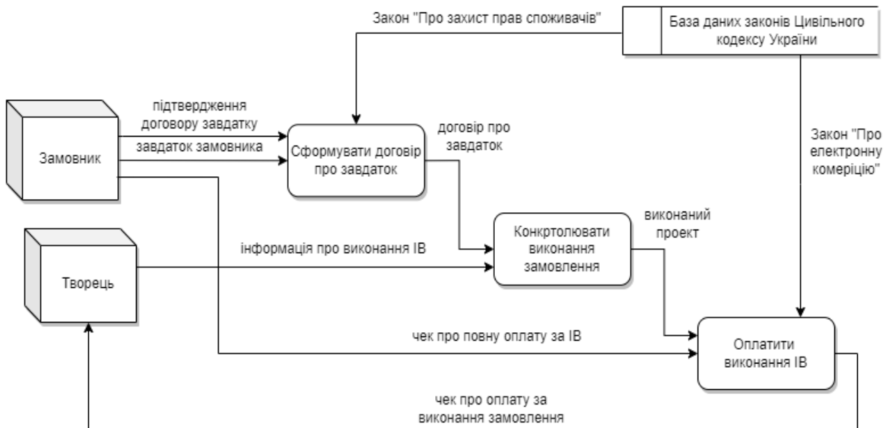
Рис. 2. Діаграма потоків даних щодо формування договору завдатку та оплати за об'єкт права інтелектуальної власності з урахуванням зовнішніх чинників впливу

Для представлення функціонування частини інформаційної системи щодо договору завдатку та оплати за об'єкт права інтелектуальної власності з урахуванням зовнішніх чинників впливу побудовано відповідну діаграму потоків даних (рис. 2).