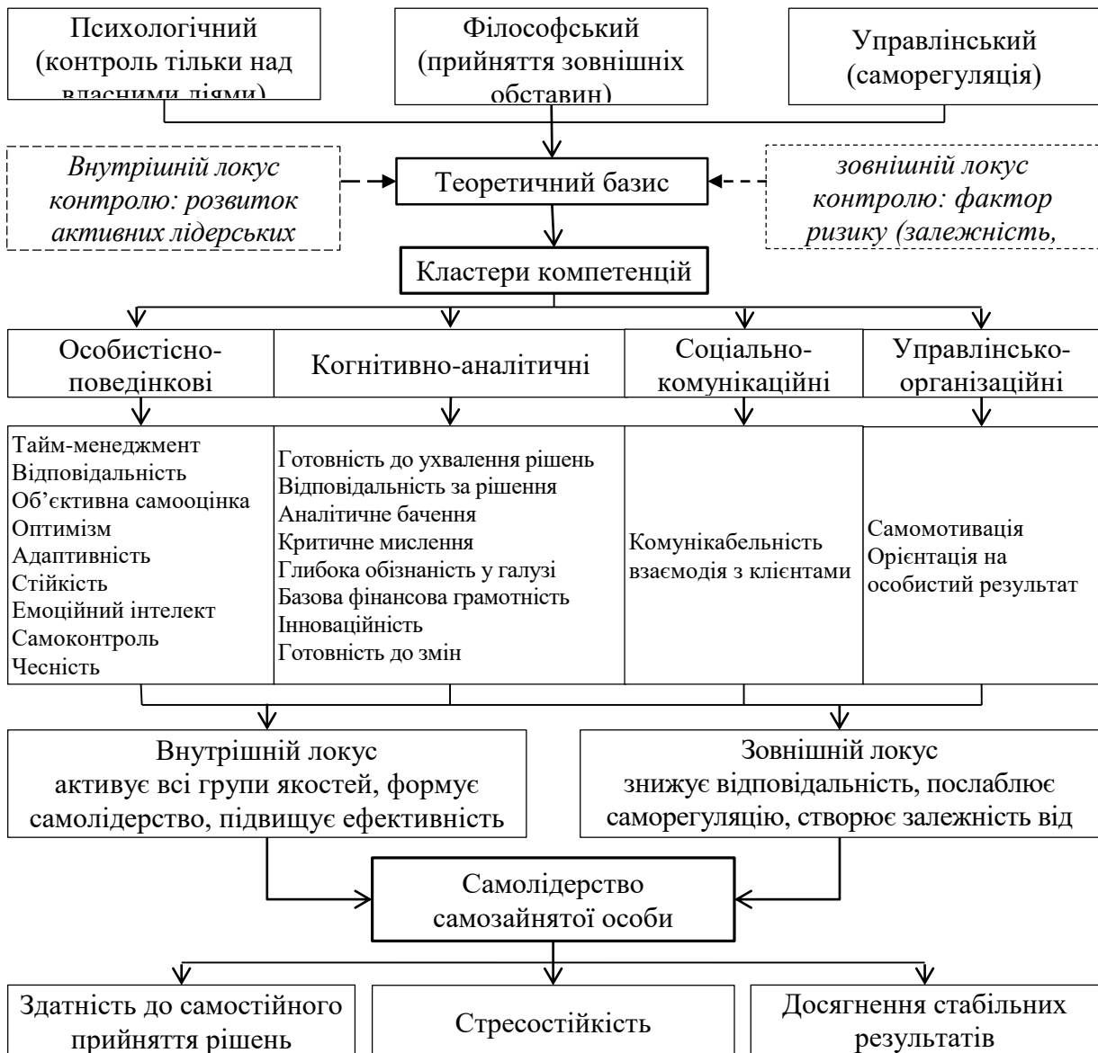
Рис. 2. Модель формування лідерських якостей самозайнятих осіб на засадах саморегуляції та внутрішньої детермінації поведінки

*сформовано автором із використанням [14, 15, 19–21]