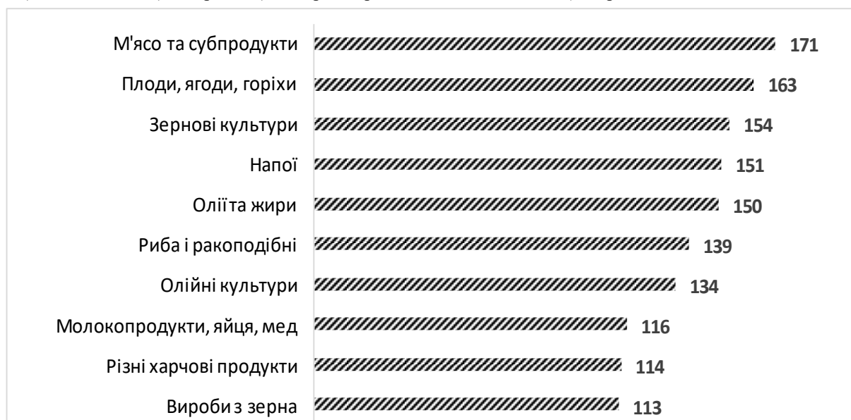
Рис. 1. Агропродовольча продукція з найбільшою вартістю експорту в світі за 2024 рік, млрд дол.

За інформацією Міжнародного торговельного центру (ІТС), серед усіх товарних груп агропродовольчої продукції в 2024 році найбільшу вартість експорту зафіксовано по м'ясу і м'ясопродуктах (171 млрд дол.), плодах і ягодах (163 млрд дол.), зернових культурах (154 млрд дол.), різних напоях (151 млрд дол.), оліях і жирах (150 млрд дол.) (рис. 1). Також на понад 100 млрд дол. здійснено глобальні поставки риби і морепродуктів, олійних, молокопродуктів, яєць і меду, різних харчових продуктів, виробів з зерна, залишків і відходів, овочів. Найменшу виручку принесли продажі інших продуктів тваринного походження (11 млрд дол.), лаків та смол (10 млрд дол.), матеріалів рослинного походження (2 млрд дол.) [2].