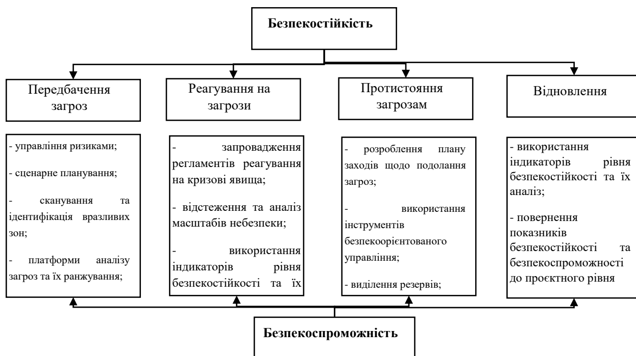
Рис. 2 Співвідношення безпекостійкості та безпекоспроможності в системі безпекоорієнтованого управління закладами охорони здоров'я

доповнювати одна одну в комплексному підході щодо забезпечення безпеки закладів охорони здоров'я (рис. 2).