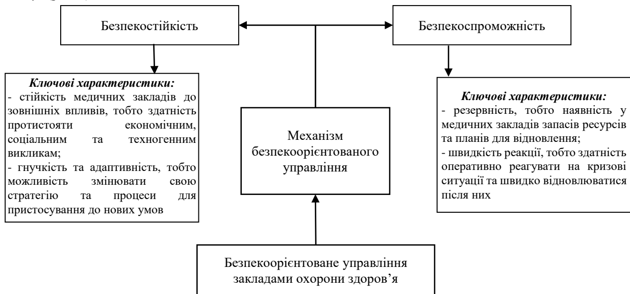
Рис. 1. Безпекостійкість та безпекоспроможність в системі безпекоорієнтованого управління закладами охорони здоров'я Джерело: побудовано автором

Таким чином, під безпекостійкістю закладів охорони здоров'я слід розуміти здатність системи в умовах негативного впливу факторів зовнішнього та внутрішнього характеру передбачати, реагувати, протистояти економічним викликам і загрозам, мінімізувати їх вплив без втрати можливості надавання якісних медичних послуг в передбачених проектних обсягах. Високий рівень безпекостійкості дозволяє закладам охорони здоров'я долати економічні коливання, непередбачені кризи та конкурентний тиск, зберігаючи довіру та впевненість зацікавлених сторін, працівників і пацієнтів. Зазначимо, безпекостійкість характеризує рівень захищеності кадрового, матеріально-технічного, фінансового та операційного потенціалів від різних загроз. В той же час, безпекоспроможність закладів охорони здоров'я означає здатність швидко відновлюватись та адаптуватись внаслідок негативного впливу факторів зовнішнього та внутрішнього характеру за рахунок сформованих резервів ресурсів, зміни організації надання медичних послуг (рис. 1).