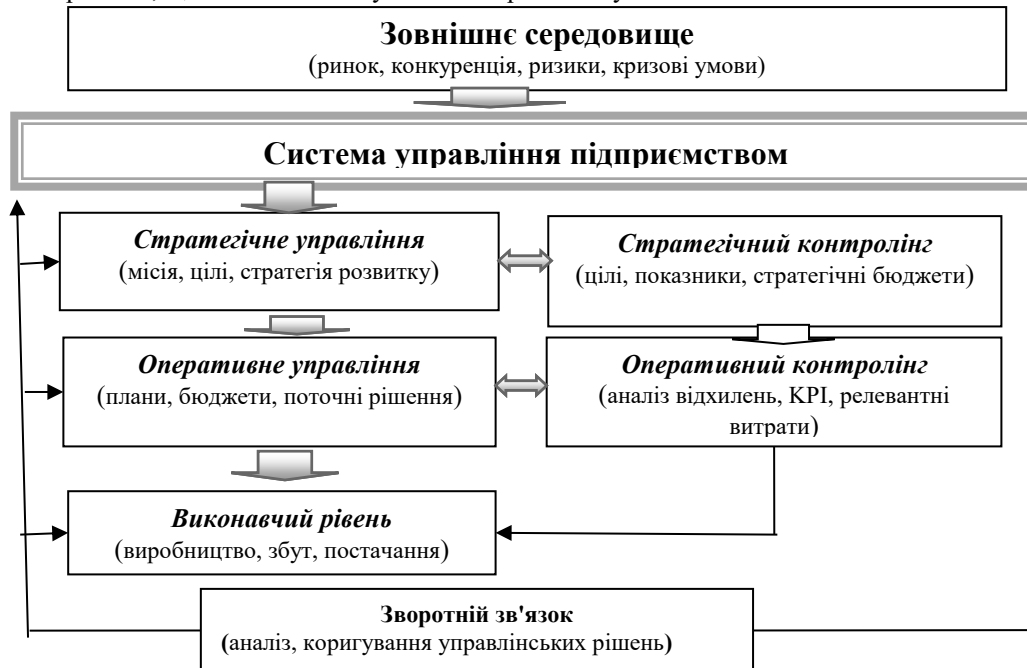
Рис. 1. Місце контролінгу в системі управління підприємством

ефективного використання ресурсів, підвищення прозорості управлінських процесів та зниження рівня управлінських ризиків, що є особливо актуальним в кризових умовах.