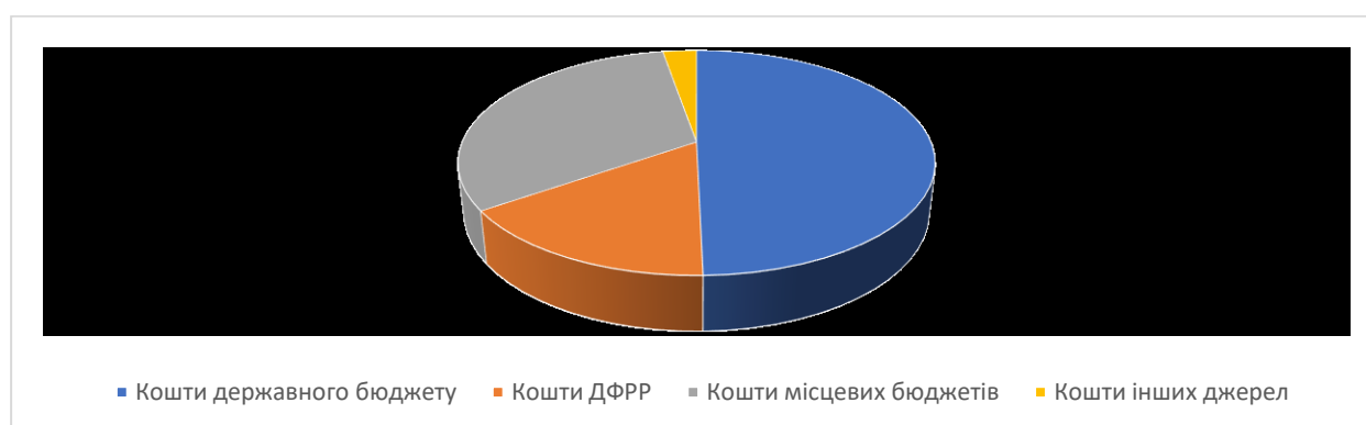
Рис. 1. Динаміка структури фінансування Стратегії розвитку Харківської області на 2021-2023 роки, тис.грн.

Таким чином, регіон суттєво залежав від державних ресурсів, а їхня частка коливалася відповідно до воєнних обставин. На рис.1 наведено розподіл джерел фінансування Стратегії розвитку Харківської області в динаміці за 2021–2023 роки.