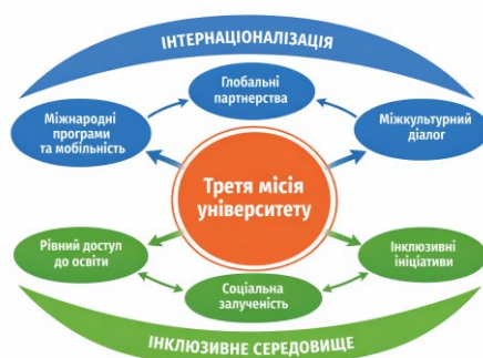
Рис. 1. Третя місія університету в контексті інтернаціоналізації та євроінтеграції

Для українських університетів третя місія в контексті інтернаціоналізації та євроінтеграції набуває стратегічного значення. Вона виступає інструментом підвищення конкурентоспроможності закладів вищої освіти, посилення їх міжнародної видимості та водночас механізмом соціальної інтеграції та відновлення. Формування інклюзивного освітнього й наукового середовища на засадах третьої місії створює передумови для сталого розвитку університетів, їх активної участі в європейському освітньому просторі та зміцнення довіри суспільства до інституції університету.