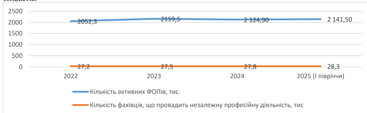
Рис.1. Динаміка кількості самозайнятих осіб, тис

Щодо підприємницької активності самозайнятих осіб, то станом на початок 2026 року в Україні працюють майже 2,2 мільйони фізичних осіб-підприємців (рис.1) [7]. Мікробізнес є важливим елементом економічного зростання України, що сприяє розвитку місцевих громад. Завдяки власній адаптивності та гнучкості він швидко реагує на зміни ринку, створює робочі місця й забезпечує наповнення місцевих бюджетів.