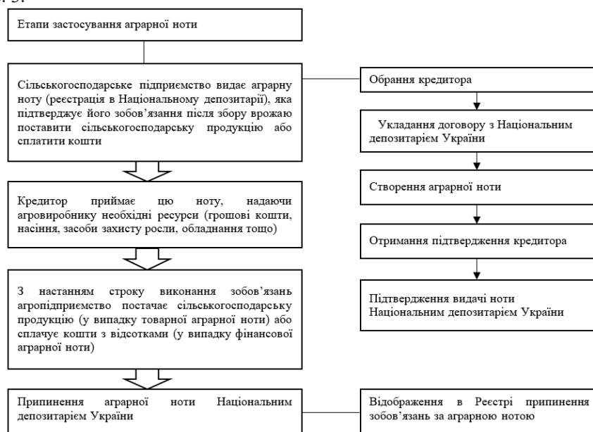
Рис. 3 Етапи застосування аграрної ноти

Етапи застосування аграрної ноти у банківській практиці у процесі фінансування агропідприємств зображені на рис. 3.