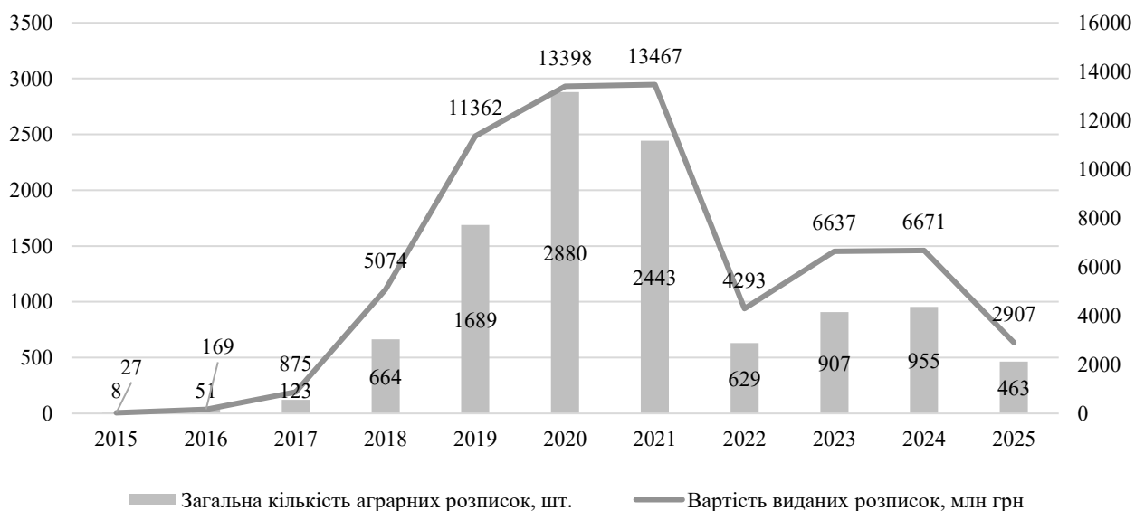
Рис. 2 Динаміка кількості та вартості аграрних розписок в Україні за період 2015-2025 рр., шт., млн грн Джерело: систематизовано автором за матеріалами [4]

В Україні вже є досвід використання аграрних розписок з метою полегшення доступу до фінансування малого та середнього бізнесу. Динаміка кількості та вартості аграрних розписок за період 2015-2025 рр. зображена на рис. 2.