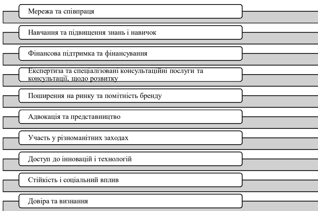
Рис. 1. Ключові вигоди членства в неурядових організаціях підтримки бізнесу

10) Довіра та визнання – зв'язок із авторитетною неурядовою організацією підтримки бізнесу підвищує довіру та репутацію члена, що може бути корисним для залучення клієнтів, партнерів та інвесторів.