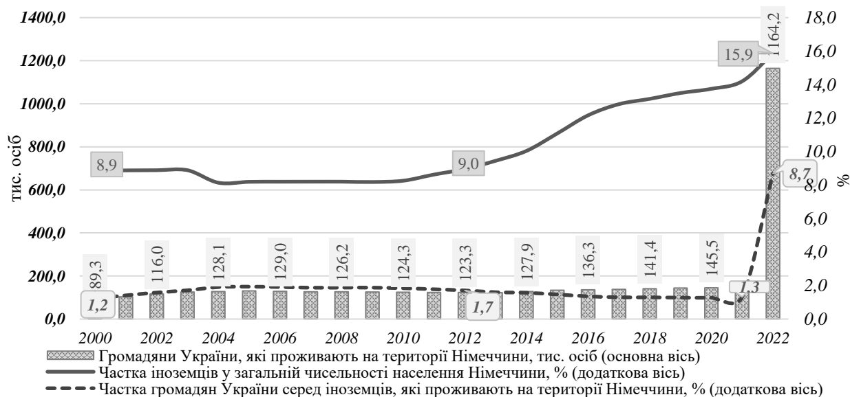
Рис. 1. Українські мігранти в Німеччині: структурно-динамічний підхід, 2000-2022 рр.

У кількісному вимірі упродовж 2022 – I півріччя 2023 рр. за програмою тимчасового захисту у ФРН зареєструвалось близько 1 млн. вимушених мігрантів, більшість з них і надалі залишаються проживати у цій країні. Загалом у Німеччині на початок 2023 року офіційно зареєстровано 1,164 млн. українців [7], з яких 86,6 % припадає на мігрантів 2022 року (рис. 1). У структурному зрізі українці становлять 8,7 % від усього іноземного населення та вийшли на друге місце за чисельністю іноземців в Німеччині після громадян Туреччини.