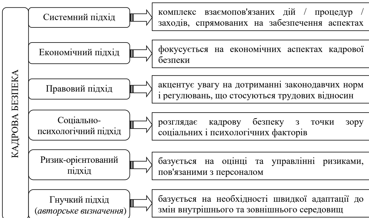
Рис. 1. Існуючі підходи щодо сутності поняття «кадрова безпека»

Наукові погляди на сутність поняття «кадрова безпека» розглядаються в контексті забезпечення стабільного функціонування підприємства за рахунок мінімізації ризиків, що пов'язані з діяльністю або бездіяльністю персоналу. Більш детально існуючі підходи щодо сутності поняття «кадрова безпека» представлено на рис. 1.