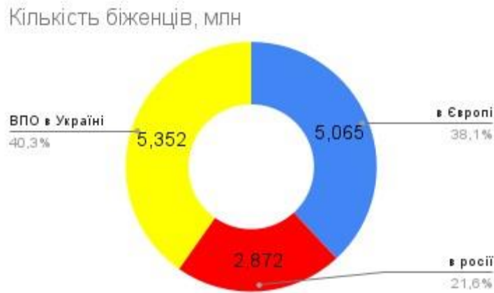
Рис. 2. Розподіл українських біженців станом на 02.05.2023 року [17]

За оцінками ООН, станом на 2 травня 2023 року, внаслідок 14 місяців повномасштабної війни росії проти України було зафіксовано 8,183 млн біженців з України [17], з них близько 2,872 млн було вивезено в росію, включаючи від 260 до 700 тисяч українських дітей [4]. Крім цього, в росії заявляють про 738 тисяч таких дітей [6]. Розподіл цих біженців за місцем перебування представлений на рис 2.