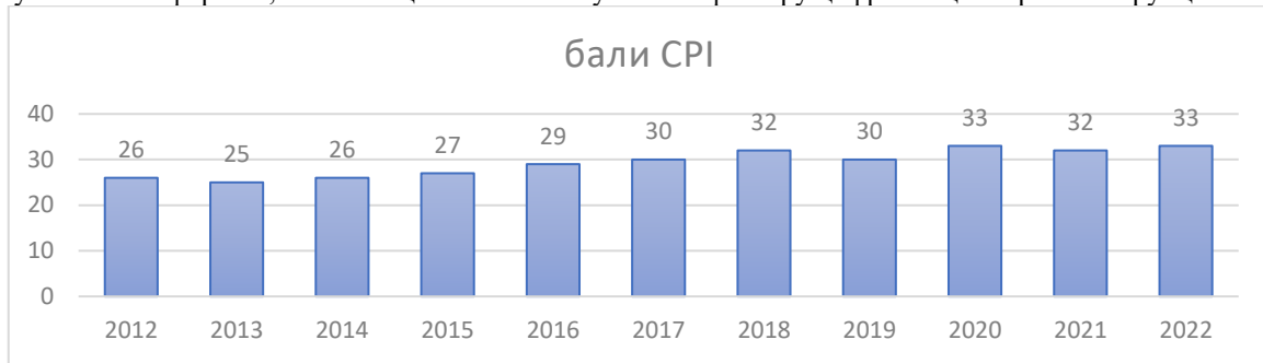
Рис. 2. Динаміка Індексу сприйняття корупції (CPI), оцінка Transparency International України Складено автором на основі https://www.transparency.org/en/cpi

В основу було закладено мету визначення економії у часовому та вартісному вимірі споживачами публічних послуг в онлайн-форматі, а також оцінено величину імпакт-фактору цифровізації на рівень корупції.