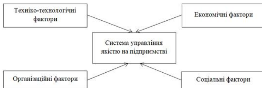
Рис.5. Фактори внутрішнього середовища підприємства

Внутрішні фактори (рис.5) поділяються на такі групи: організаційні; техніко-технологічні фактори; економічні; соціальні.