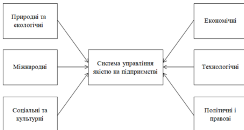
Рис.1. Фактори макросередовища, підприємства, які впливають на систему управління якістю підприємства

Фактор внутрішнього середовища підприємства є одночасно технологія. На темпи старіння продукції впливає сучасна технологія. Технології, що відбулися на системі управління якістю на підприємстві це: створені нові матеріали, біотехнології, комп'ютерна, лазерна технологія тощо.