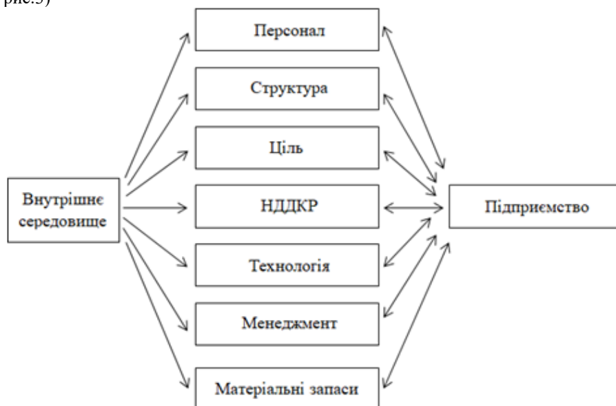
Рис.3. Елементи внутрішнього середовища, та впливають на систему управління якістю на підприємстві

Елементи внутрішнього середовища визначають ступінь взаємодії підприємства із зовнішнім середовищем (рис.3)