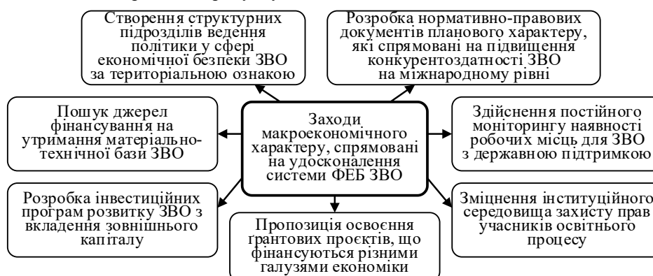
Рис. 1. Заходи макроекономічного характеру, спрямовані на підвищення рівня фінансово-економічної безпеки ЗВО

До заходів на макроекономічному рівні, окрім моніторингу стану фінансово-економічної безпеки ЗВО, слід віднести ті, які зображені на рисунку 1.