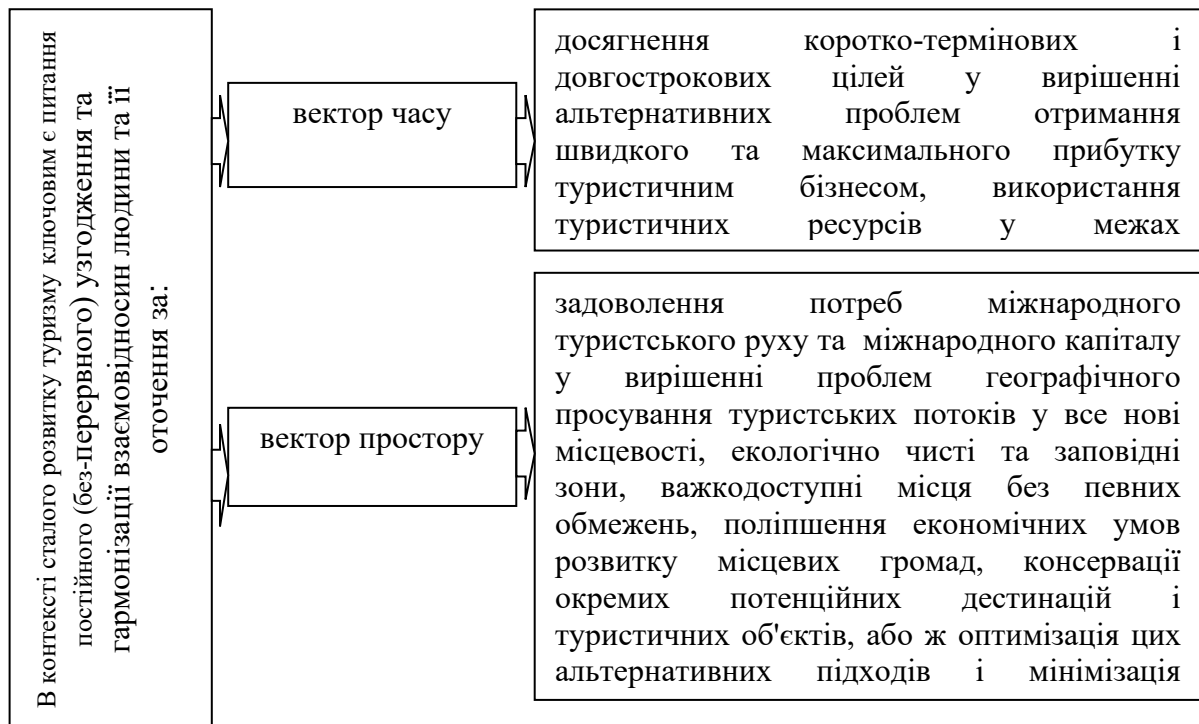
Рис. 2. Взаємовідносини людини та її оточення в контексті збалансованого розвитку туризму

спадщини, раціонального використання наявних природних ресурсів, залучення інвестицій, модернізації застарілої інфраструктури.